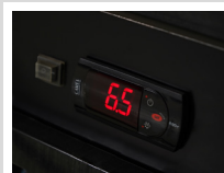
Controlador Electrónico CAREL