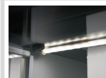
Iluminación interna LED de 4 watts