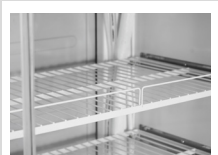
Estantes de rejillas metálicas