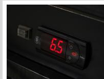
Controlador Electrónico CAREL