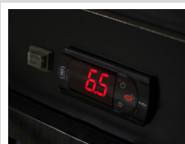
Controlador Electrónico CAREL