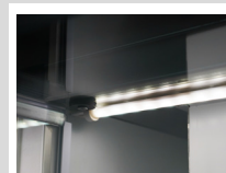
Iluminación interna LED de 4 watts