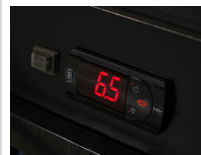
Controlador Electrónico CAREL