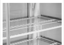
Estantes de rejillas metálicas