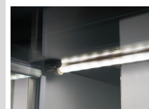
Iluminación interna LED de 4 watts