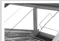
Puertas correderas de acrílico desmontables