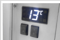
Controlador Electrónico CAREL