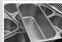
12 cubas de 5 Lt.