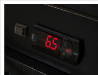
Controlador Electrónico CAREL