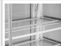
Estantes de rejillas metálicas