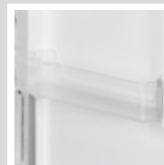
Contenedor de bebidas.