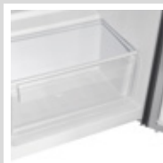
Gaveta de almacenamiento