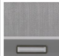
1 Filtro de Aluminio 1 Luz Led de 1.5 W