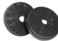
2 Filtros de Carbono