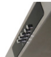
5 Botones Pulsadores