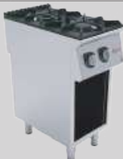
6E704 GLP - 6E704N GN